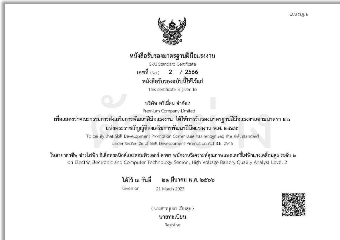
ภาพที่ 3.9 ภาพแสดง รมฐ. 2 ที่เสร็จสมบูรณ์

แห่ง พ.ร.บ. ส่งเสริมการพัฒนาฝีมือแรงงาน พ.ศ. 2545 โดยวิธีการทางอิเล็กทรอนิกส์